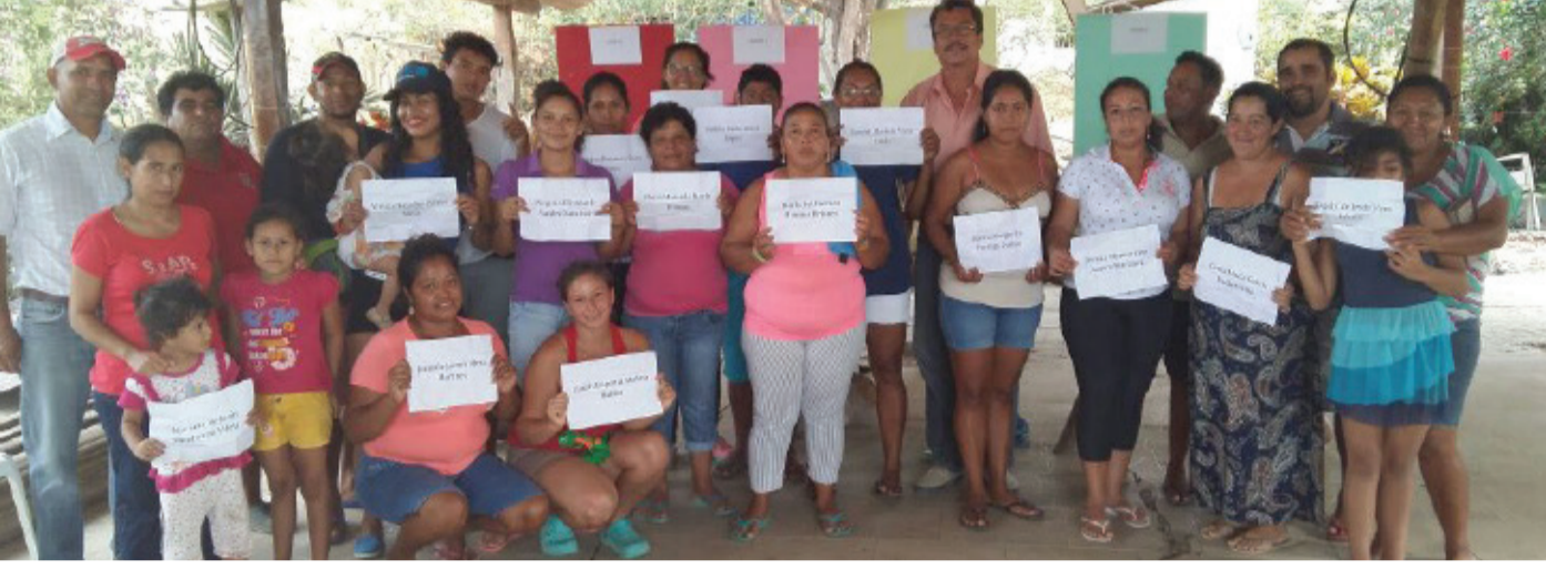
Foto: Beneficiados para vivienda