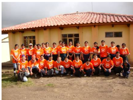
Las mujeres que participaron en la categoría femenina de la tercera carrera por la amistad, realizada el primero de agosto del 2009.