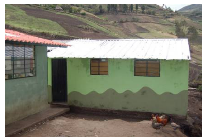
Los baños para la escuela de Columbe Grande. Hay cerca de 100 estudiantes que frecuentan este centro educativo bilingüe (español/Kichwa).