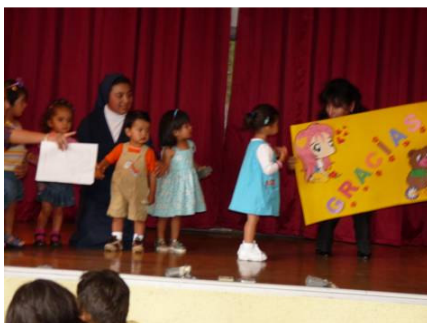
Los más pequeños del orfanato se presentaron al público en un conmovedor desfile de modas.