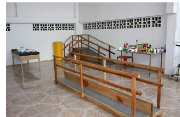
Los implementos instalados en el aula.