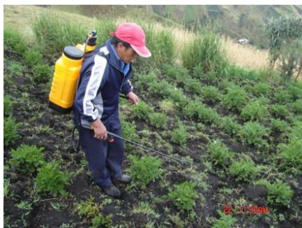
Se realizó una actividad para la elaboración y uso de un fertilizante orgánico producido por los excrementos de los animales (BIOL). Esta actividad es parte de una tesis realizada por dos estudiantes de la Universidad Politécnica del Ejército (ESPE).