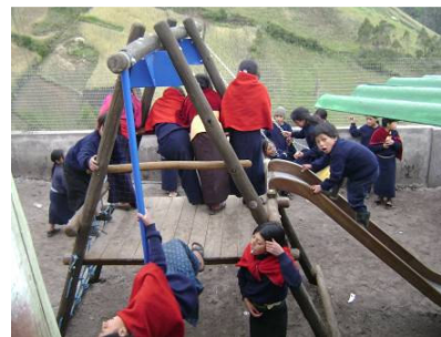
Área de juegos de la Esperanza instalada cerca de la escuela en el mes de mayo del 2009.