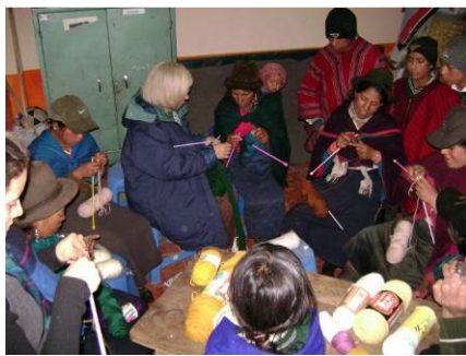
El curso de tejido fue todo un éxito e incentivó a las mujeres de la Esperanza a recordar esta práctica olvidada.