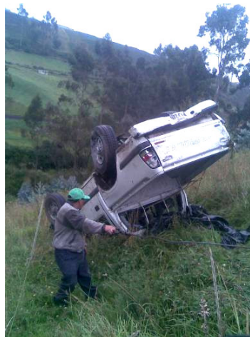
La última imagen de nuestro vehículo.

El 11 de febrero del 2009 a causa de un accidente de tránsito nuestro automóvil dejó de circular. La aseguradora nos reembolsó 10.800 dólares. Gracias a la colecta de 3.500 dólares de un grupo de amigos alemanes y a la contribución de 5.700 dólares obtenidos de Bormiadi 2009, logramos reunir 20.000 dólares que servirán para la compra de una nueva camioneta. Estamos esperando la autorización de las autoridades competentes para poder adquirir el nuevo vehículo exonerado de aranceles e impuestos.