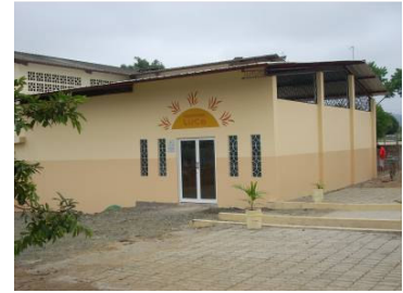
La nueva aula de fisioterapia de Chone

Invitamos a fisioterapeutas interesados en apoyar este proyecto y dar una mano a contactarnos: info@ayudadirecta.org