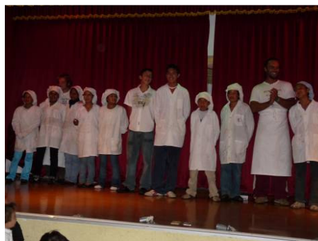
Los chicos de la cocina sorprendieron a todos con su excelente propuesta gastronómica.