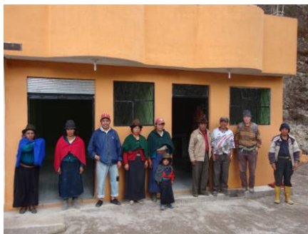
La cocina y la tienda comunitaria de Cagrin Buena Fé. Los trabajos comenzaron el 13 de julio del 2009 y terminaron a finales de año.