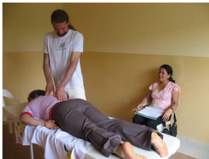
Carlo inaugura la nueva camilla