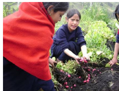
El proyecto de los huertos escolares tiene como objetivo recuperar semillas nativas, promover el uso de agricultura orgánica y concientizar a profesores y estudiantes sobre la importancia de una dieta alimenticia balanceada.