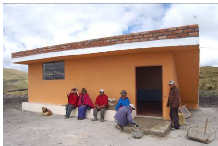
La cocina de Toropamba (3.850 m.s.n.m) que será usada por los habitantes de la comunidad.