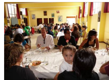
El salón del orfanato que fue utilizado como restaurante.

El 14 de noviembre del 2009 en el orfanato San Vicente de Paúl de Quito se realizó nuestra primera actividad de socialización de los proyectos que emprende Ayuda Directa en Ecuador. En este almuerzo solidario los asistentes pudieron disfrutar de excelente comida italiana y conocer de cerca las actividades llevadas a cabo por Ayuda Directa.