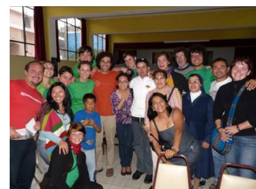
Todos contentos después del evento.