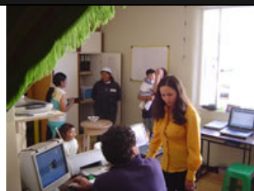
La oficina de Quito

En el mes de mayo de 2005 nuestras oficinas se trasladaron a una casa ubicada en Quito en la Calle Lizardo García 452 y 6 de Diciembre. La casa se arrienda en 350 dólares mensuales, y tiene 4 dormitorios donde se hospedan los distintos voluntarios que visitan nuestros proyectos y contribuyen al financiamiento de los costos de arrendamiento.