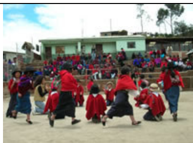
La inauguración de las tribunas en La Esperanza