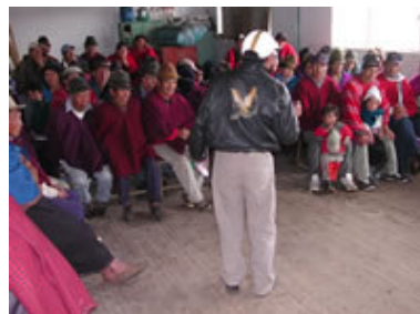
Cursos de higiene y prevención de enfermedades en la Esperanza