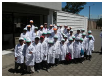
Los niños de la Esperanza en su visita a la fábrica de la Ferrero en Ecuador