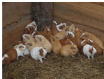
La crianza de cuyes representa una alternativa económica para evitar la deforestación

Ayudamos el pueblo de Las Tolas a incrementar la venta de la artesanía en Tagua (marfil natural) enviando muestras artesanales a varios contactos en Italia, Estados Unidos y Alemania y promoviendo su venta en mercados eco-solidarios.