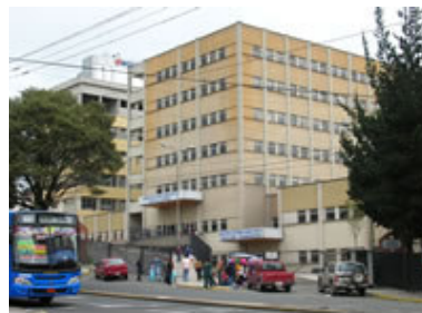
El Hospital de Niños Baca Ortiz en Quito

Muchos pacientes que provienen de sectores marginales de la capital y con necesidades de atención médicas recibieron ayuda durante el año a fin de poder realizarse exámenes, operaciones y comprar medicinas, aparatos auditivos, etc. En total se invirtieron alrededor de 14.000 dólares.