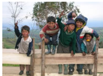
El programa Guagua ayuda a 230 niños ecuatorianos en sus estudios

Hemos continuado nuestro apoyo a este centro, manejado por las Hermanas del Buen Pastor, cuyo principal objetivo constituye rescatar de la prostitución a muchas jóvenes adolescentes. Hemos pagado el sueldo a una profesora que está desarrollando un curso de belleza y cerámica.