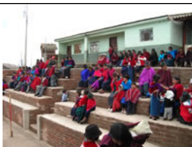
Un espacio para asistir a los eventos organizados por la comunidad