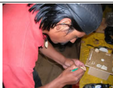
Las Tolas, artesanía ecológica en TAGUA (marfil vegetal)

Abajo las fotos de los baños construidos para las comunidades de::