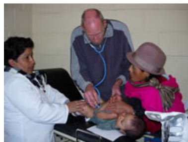
Brigada medica, con especialistas directamente en las comunidades