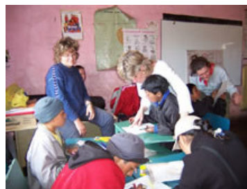
Cursos de inglés con los niños de Gahuijón