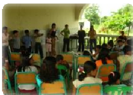
Momentos del taller "Arte con basura" en Esmeraldas