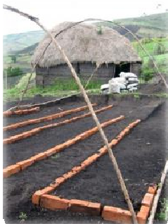
La construcción de un pequeño vivero para plantar arboles nativos.