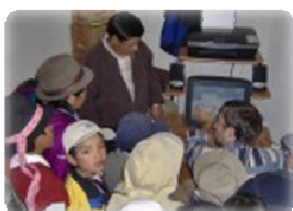
La entrega de una computadora en la Comunidad de Retén