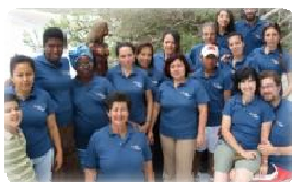
Los voluntarios en la tradicional Convención del Programa Guagua.