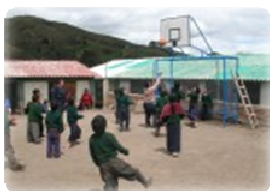
Inaugurando el nuevo tablero de baloncesto en la Esperanza