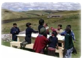
Entrega de mesas para el comedor de Toropamba