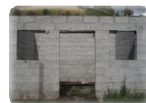
Las primeras etapas de la construcción de la cocina de Lupaxi Bajo

El 11 de marzo de 2008 comenzó en algunos pueblos indígenas del Cantón Colta una serie de cursos de medicina natural y ancestral con el fin de recuperar los conocimientos tradicionales y el uso de numerosas plantas medicinales en el campo de salud.