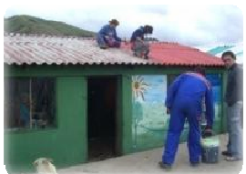
Trabajos de mantenimiento de la cocina de la escuela de la Esperanza.

Toma su nombre de la comunidad indígena donde iniciamos nuestros proyectos de desarrollo sostenible. El proyecto Esperanza, se inicia a finales de 2002 con el objetivo de mejorar constantemente las condiciones de vida de la población. Actualmente, además de la Esperanza, se coopera en otras 6 comunidades indígenas del Cantón Colta provincia del Chimborazo, considerada como una de las zonas más pobres del Ecuador por la carencia de servicios básicos como agua potable, educación de calidad y acceso a la salud.