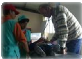
Momentos de la brigada medica en las principales localidades de Chimborazo