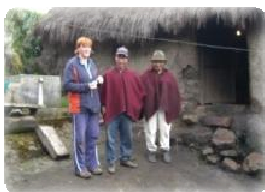
Visita a domicilio a un paciente.