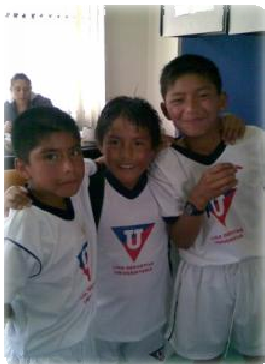
Algunos niños que asisten al curso de fútbol.