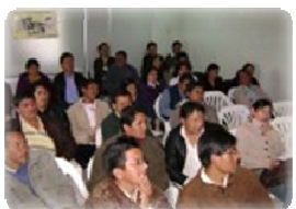
Los directores de las escuelas secundarias se reunieron para la presentación del proyecto mejora de la alimentación.