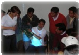
El curso de computación en Riobamba con todos los profesores de las escuelas involucradas en nuestro proyecto