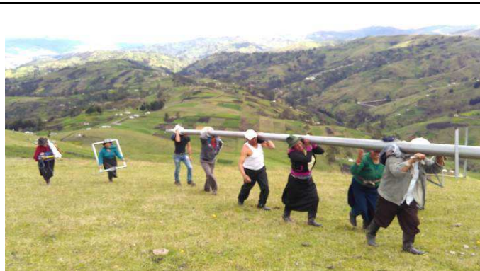
Se transporta en hombro un poste de 9 metros a una altitud de 3.900 m.s.n.m para instalar las antenas WI-FI.