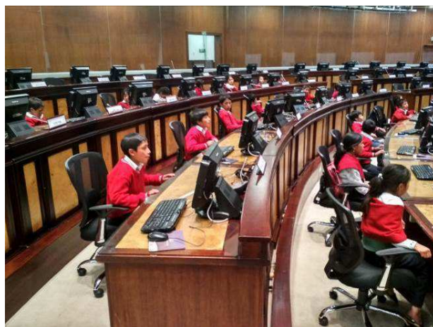
Los niños de La Esperanza visitaron la "Asamblea Nacional"