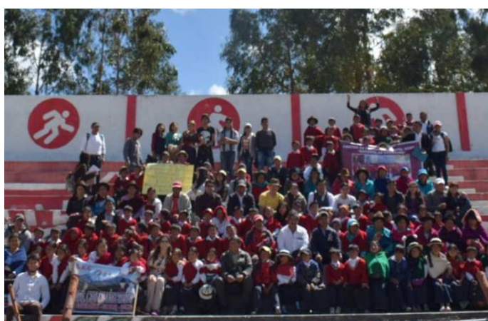
Presentación de los niños en el Colegio P. Vicente Maldonado