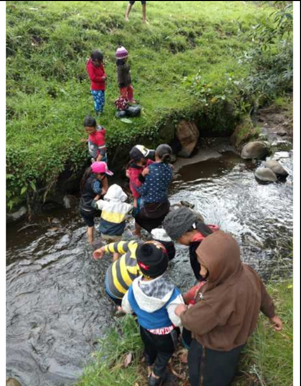
Niños guías de las caminatas