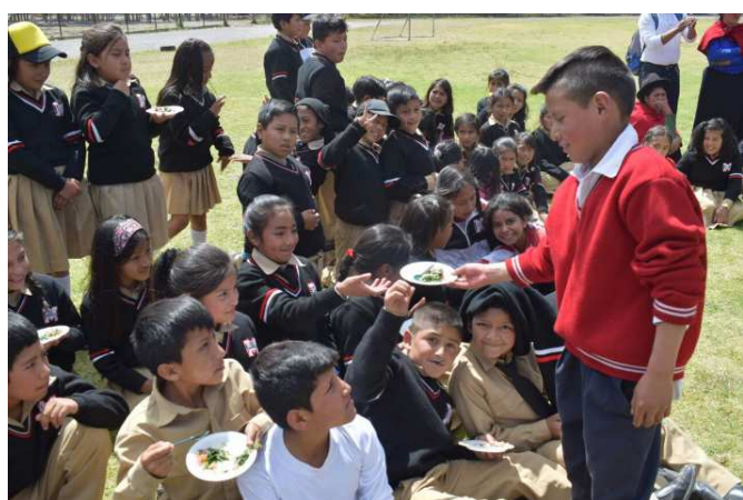
Compartiendo gastronomía y tradiciones con niños de la ciudad