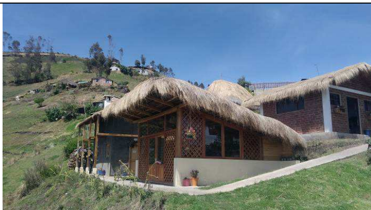
La vista externa del restaurante construido en 2017 en Esperanza.

Además, en diciembre se instalaron paneles solares adicionales para aumentar la producción de electricidad fotovoltaica en la estructura comunitaria. Es posible encontrar la propuesta de turismo comunitario en los sistemas de reserva en línea más comunes como: Booking.com y Airbnb.com. Poco a poco, las solicitudes de turistas de diferentes partes del mundo están empezando a llegar. Es alentador leer los comentarios positivos de quienes han tenido la maravillosa oportunidad de visitar y experimentar la vida en la Esperanza.