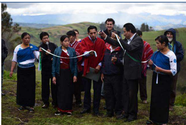
El Alcalde de Colta realiza el corte de la cinta inaugural

Hasta fines de junio de 2017, se entregó un reconocimiento económico mensual a la persona responsable de la administración de la quesería por un total de $ 3,800. En los primeros meses del año 2017 también se canceló el saldo de $ 1,000 a la empresa consultora de Quito que llevó a cabo talleres de capacitación y planificación en el segundo semestre de 2016. Se debe indicar que actualmente la quesería de La Esperanza todavía no genera utilidades. El proceso de consolidar una actividad económica rentable requiere del fortalecimiento de las capacidades del personal local; así como, de la consolidación de un mercado estable. Estamos trabajando para lograr este objetivo considerando todos los desafíos que implica administrar un negocio en comunidades rurales del Ecuador.