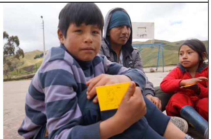
Dinámica de las tarjetas con cualidades del compañero