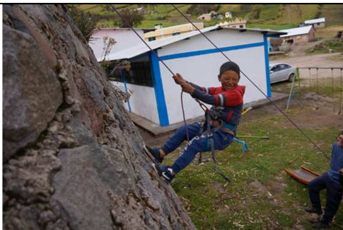
Dinámica de rapel