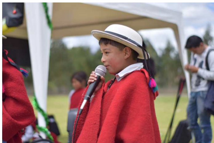
Relato de leyendas