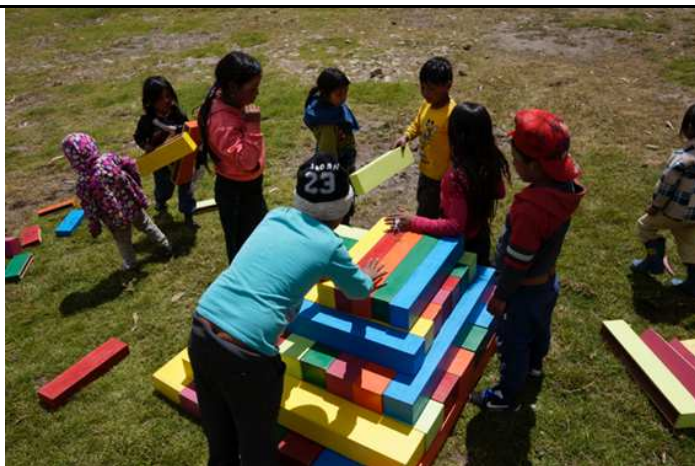
Dinámica de la pirámide