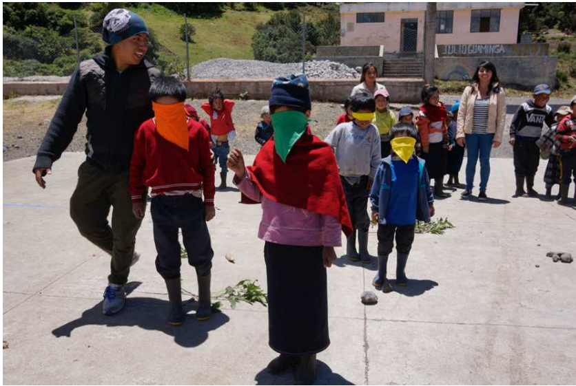
Interiorizando lo que es ser guía y turista en la dinámica de campo minado.