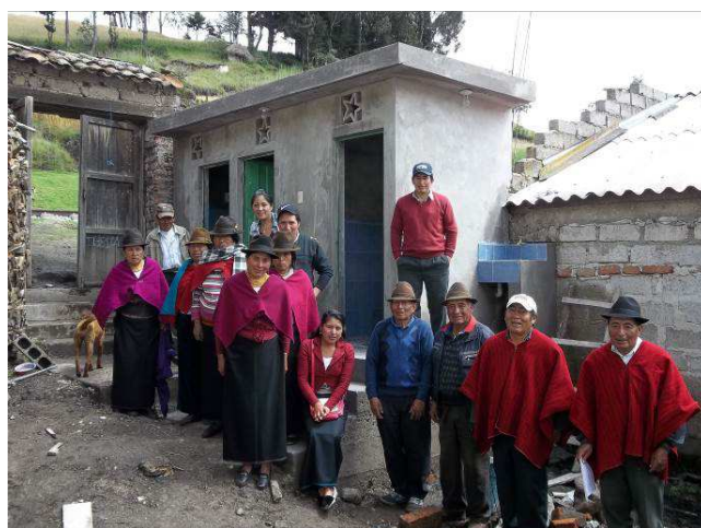
Moradores de Chacabamba Centro