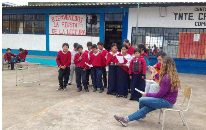
Voluntarios de Ayuda Directa en la escuela de La Esperanza (Nov. 2017)

Hasta finales de 2017, hay 282 niños beneficiados (igual al año anterior), 273 patrocinadores activos, de los cuales 201 (73,6%) están utilizando el sistema de correspondencia on-line reemplazando al envío de cartas físicas. Con este sistema se reducen los costos y los tiempos, agilitando mucho nuestro trabajo y fortaleciendo la comunicación. Invitamos a quienes todavía no disponen de los códigos de activación, solicitar uno enviando un correo electrónico a info@ayudadirecta.org .