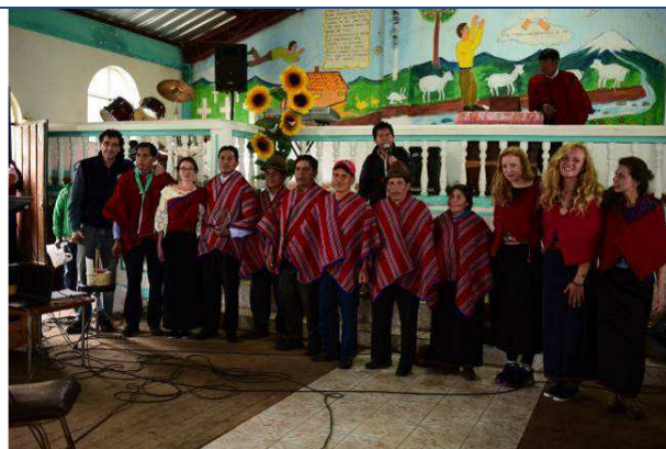
Mordores de Esperanza y voluntarios durante la inauguración