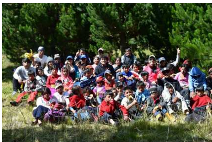
Paseo al Chimborazo para interactuar con otras comunidades