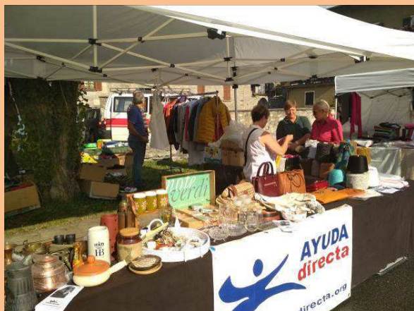
El mercado de pulgas de Bormio 06-08-2017