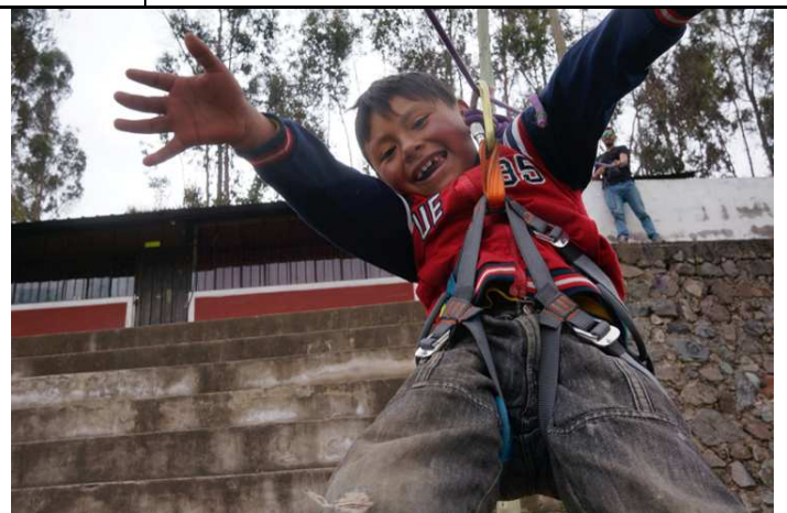
Dinámica de tirolesa