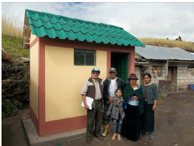
El control y la entrega de una batería sanitaria