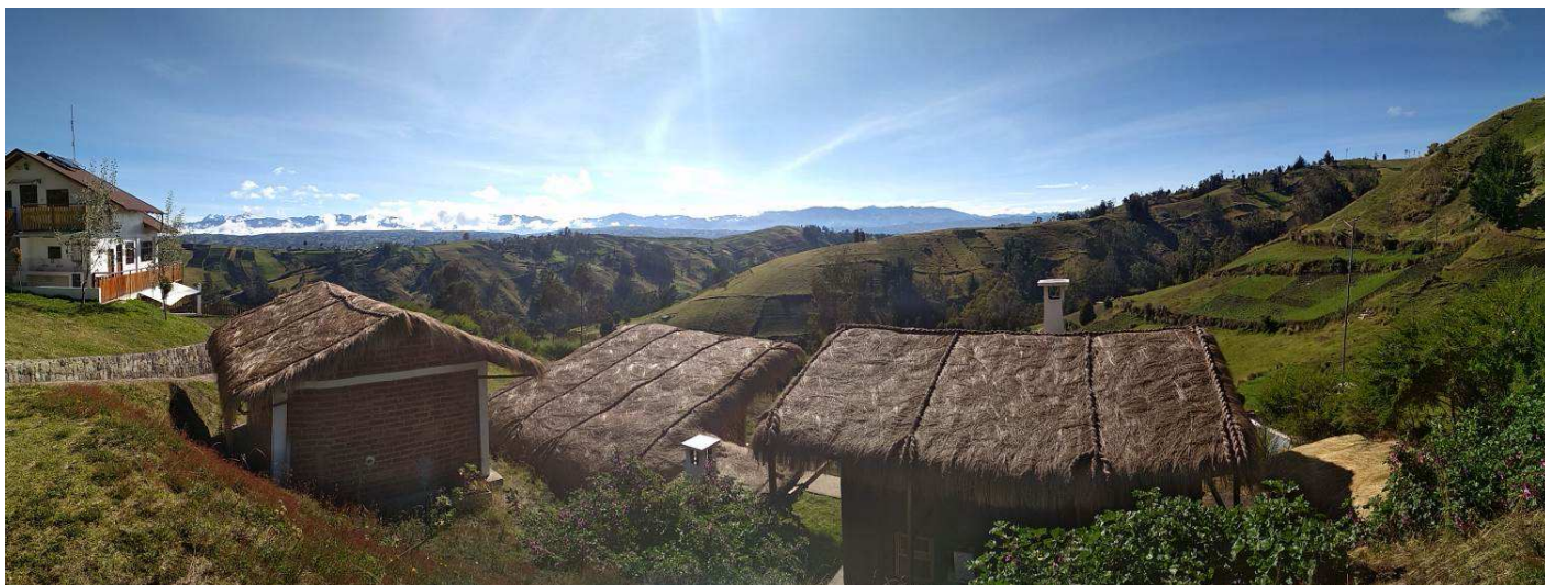
Foto: en primer plano las estructuras que albergan el turismo comunitario, a la izquierda la quesería (Esperanza 2017)