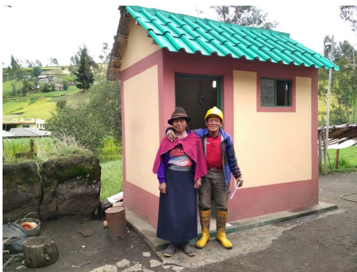
Una pareja frente al nuevo baño construido por Ayuda Directa.