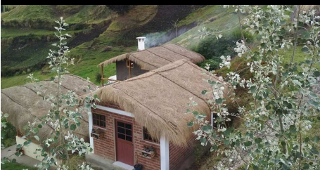
Booking.com Guest Review Award 2018