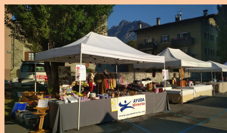
Mercados de pulgas- Bormio 05-08-2018