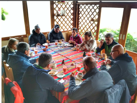
Un grupo de italianos desayunando