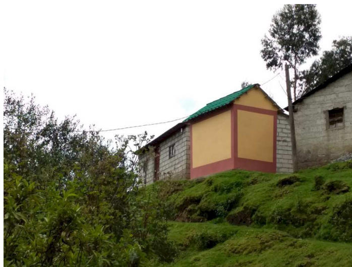
La imagen de uno de los 284 baños construidos en el Cantón Colta.