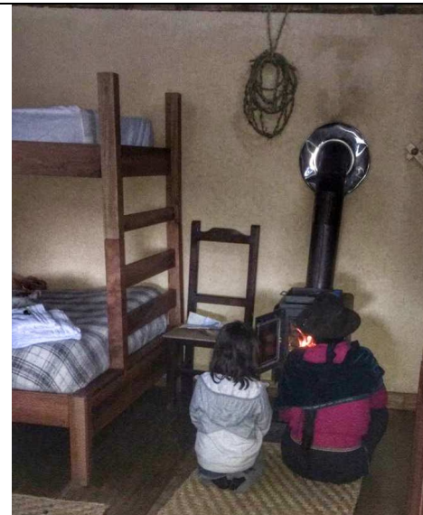
La magia del fuego