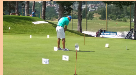
La Louisiana della Magnifica Terra 14-07-2018