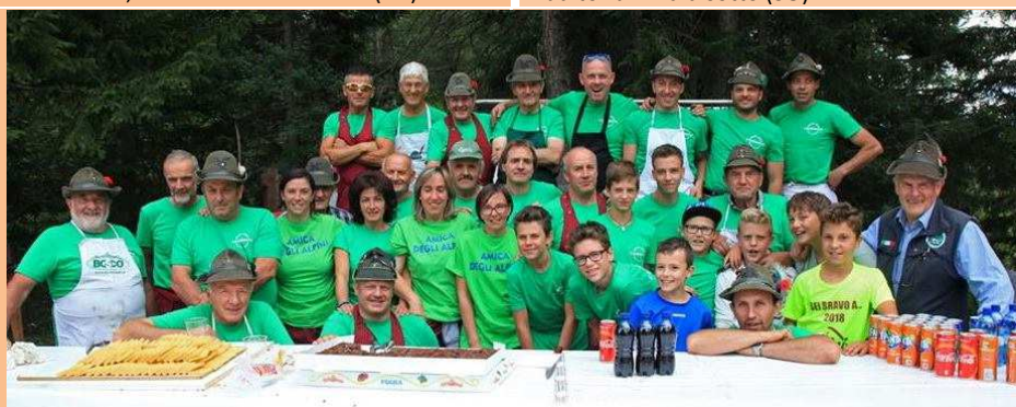
El grupo Alpini Valdisotto (Sondrio) contribuyó con 2.000 Euro