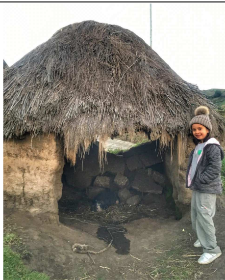
A Sofia siempre le encanta regresar a Esperanza