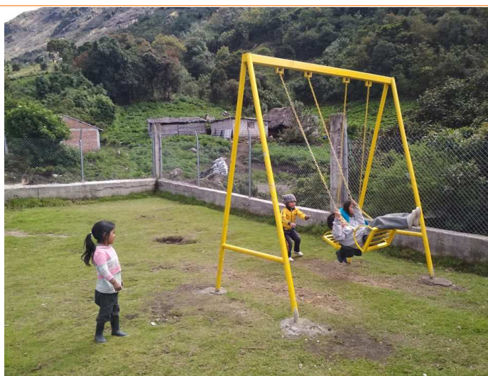
Los nuevos juegos para la escuela de Ambrosio Lasso (noviembre de 2018)