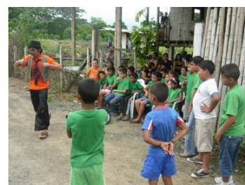
Una de las actividades recreativas para divertir a los chicos de nuestro programa Guagua, mayo 2010

Los fondos se utilizan para realizar algunas obras en las escuelas (por ejemplo baños, arreglo del aula, material didáctico, etc) y beneficiará directamente a los niños apadrinados e indirectamente también a todos los niños de la escuela.