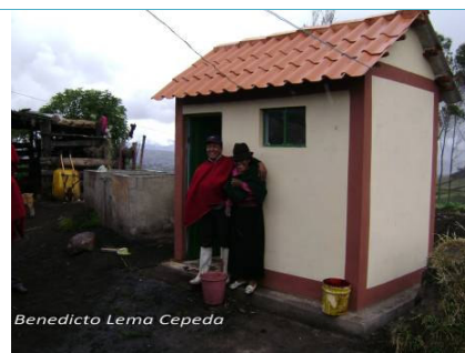
Uno de los 27 baños familiares construidos en la comunidad de Cochaloma, Cantón Colta.