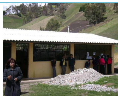
El aula de Gahujón terminada en el mes de mayo del 2010. En el interior la sala de profesores y la secretaria.