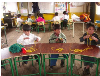
Curso de artesanía en las escuelas.