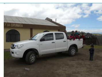
Nuestra nueva camioneta adquirida en el mes de agosto del 2010.

Todo el resto de dinero fue destinado en su totalidad a nuestros proyectos, así como se indica en el presente informe.