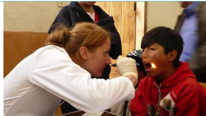
La presencia de voluntarios y estudiantes de medicina es muy apreciada por la gente local.