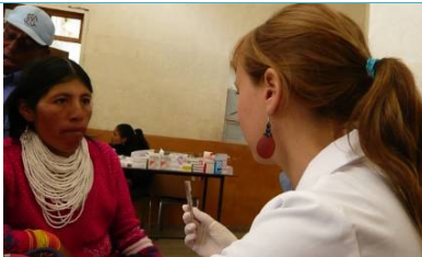
Las actividades médicas y de prevención continuaron en el 2010 en diferentes comunidades indígenas del Cantón Colta, Chimborazo.