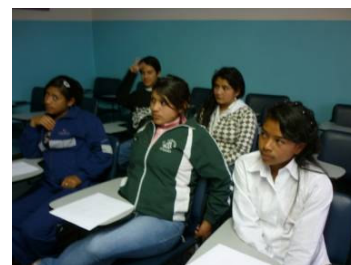
El de 10 diciembre 2010 se realizó una charla sobre educación sexual con los jóvenes del orfanato