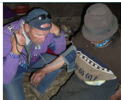
Los más ancianos fueron visitados directamente por un médico en sus viviendas.