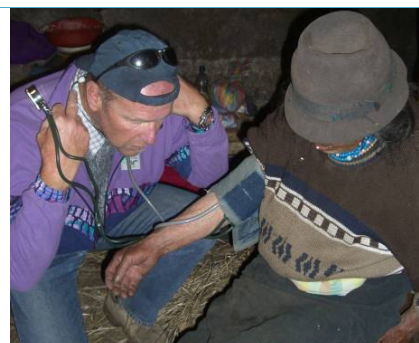
I più anziani sono stati visitati dal medico direttamente nelle loro capanne.