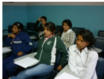
Il 10 dicembre 2010 si è tenuto un laboratorio di educazione sessuale con i giovani dell'orfanotrofio

Nei primi mesi del 2011 entrerà in funzione la possibilità di ricevere la corrispondenza tramite internet. Infatti nel nostro sito internet verrà a breve attivata un'area riservata ai sostenitori, dove sarà possibile vedere tutte le informazioni del bambino. I padrini che usufruiranno di questa nuova opportunità, ci permetteranno un alleggerimento del nostro lavoro d'ufficio e una riduzione di costi.