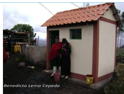
Uno dei 27 bagni familiari costruiti nel villaggio di Cochaloma, Canton Colta.