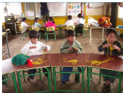
Corsi di artigianato nelle scuole