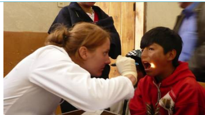
La presenza di medici volontari e studenti di medicina è sempre molto apprezzata dalla popolazione locale