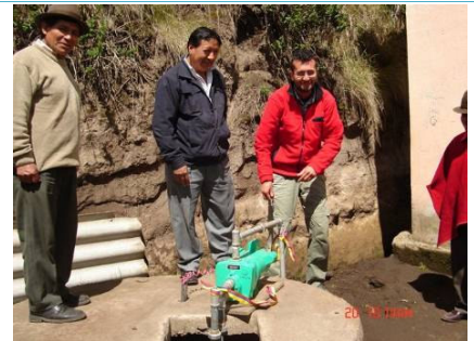
Una pompa per fornire acqua alla scuola di Pulucate è stata consegnata nel mese di maggio 2010