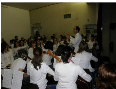
L'orchestra Martino Anzi di Bormio con i suoi 70 musicisti delle scuole medie