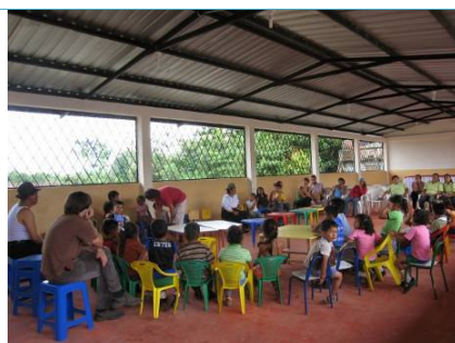
Una veduta degli interni della nuova aula costruita nel villaggio di Nueva Union.