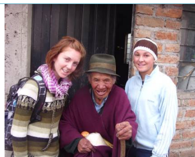
Gli anziani di Esperanza e Cochaloma sono stati visitati dai nostri volontari.

Da menzionare anche le varie attività tenute dai nostri volontari come il disegno e la creazione di piccoli oggetti d'artigianato.