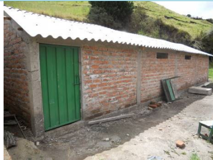
In fase di ultimazione, questa foto mostra la parte esterna della "cuyera", ossia il fabbricato adibito all'allevamento dei cuy (porcellini d'India)