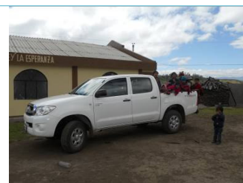
Il nostro nuovo automezzo acquisito nel mese di agosto 2010

Tutto il resto è andato integralmente ai nostri progetti, così come indicato nella presente relazione.