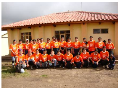
La categoria femminile partecipante alla Terza corsa in montagna dell'amicizia, svoltasi il primo agosto 2009.