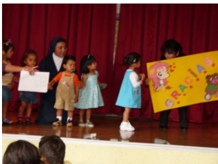
I più piccoli dell'orfanotrofio si presentano al pubblico in una commovente sfilata di moda