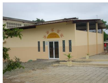
La nuova aula di fisioterapia di Chone

Invitiamo fisioterapisti che volessero dare una mano a contattarci.