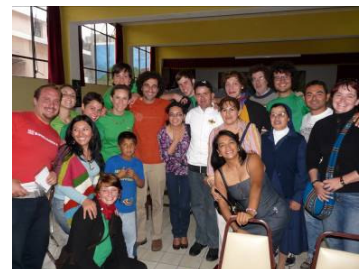
Tutti contenti al termine dell'evento