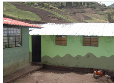
I bagni per la scuola elementare di Columbe Grande. Sono circa 100 gli alunni che frequentano questo centro educativo bilingue (spagnolo/Kichwa).