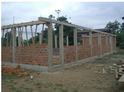
A sinistra l'aula di Nueva Unión, che misura 21 metri di lunghezza e sarà di molteplici uso: oltre a servire come aula scolastica, offrirà infatti anche uno spazio di riunione per la gente del villaggio. Il progetto è stato parzialmente finanziato dalla Provincia di Bolzano.

Esperanza è la prima comunità indigena della Provincia di Chimborazo dove tutte le famiglie dispongono di docce con acqua calda. Nel mese di novembre 2009 abbiamo acquistato 47 scaldabagni alimentati a gas.