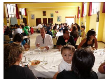
Il salone dell'orfanotrofio è stato adibito a ristorante

Il 14 novembre 2009 presso l'orfanotrofio San Vicente de Paul di Quito è stata organizzata la nostra prima attività di fund raising in Ecuador, un pranzo al quale hanno preso parte un centinaio di persone che hanno potuto conoscere da vicino le attività portate avanti da Ayuda Directa in Ecuador.