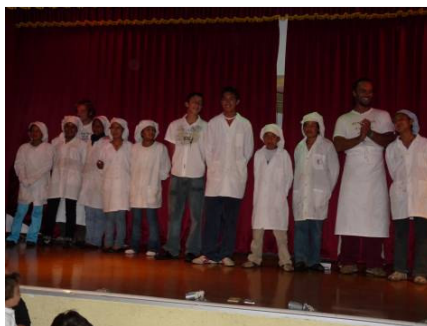
I ragazzi della scuola di cucina hanno stupito tutti con un'eccellente proposta gastronomica