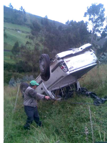
L'ultima immagine del nostro veicolo