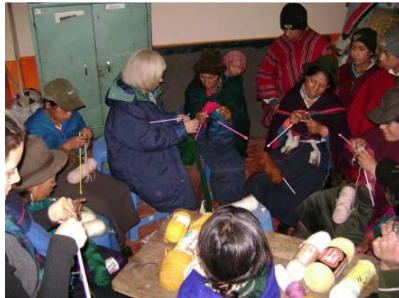
Il corso di lavorazione a maglia ha riscosso un particolare successo e ha incentivato le donne di Esperanza a riprendere attività quasi dimenticate o accantonate.