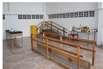
Le attrezzature installate nell'aula