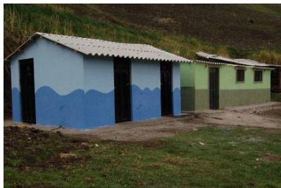
I bagni (a sinistra) e la cuyera (a destra), ovvero lo spazio per l'allevamento di cuy (porcellini d'india) costruiti nella scuola di Huacona Chico