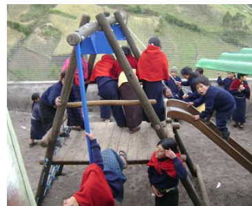
Il parco giochi della scuola di Esperanza installata nei pressi della scuola nel mese di maggio 2009