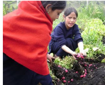
Il progetto degli orti scolastici ha come obiettivo quello di recuperare semi nativi, lavorare solo con sistemi biologici, coinvolgere professore e studenti per ottenere una dieta alimentare bilanciata.