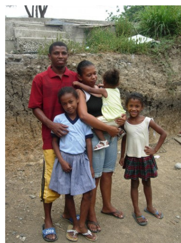
Una famiglia di Esmeraldas beneficiaria della borsa di studio